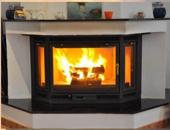
Anthrazit, Erker mit feststehenden Seitenfenstern