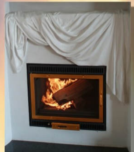
Türrahmen und Aschkasten in Messing

Exklusiv-Vertrieb: Vertriebszentrale Roland Hüller Scheibenbuckstr. 35 D - 78187 Geisingen Tel.: +49(0)7708 - 920 784 Fax: +49(0)7708 - 920 785 Mobil: +49(0)160 - 610 78 05 e-mail: info@kaminkassette.de Internet: www.kaminkassette.com