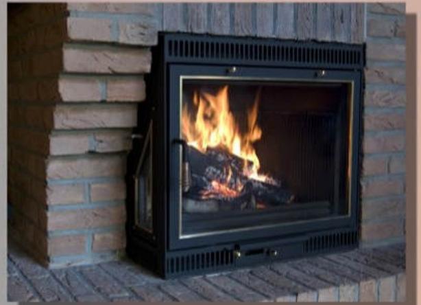
Anthrazit, Messing-Eckleisten, schräges Seitenfenster