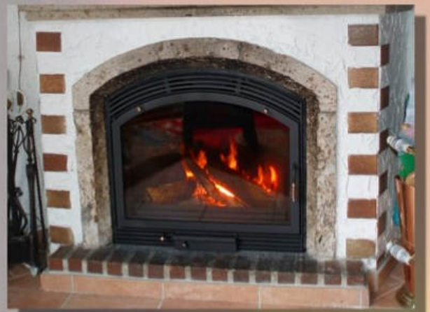
Anthrazit, Querlamellen, Rundbogen an Kassette und Tür