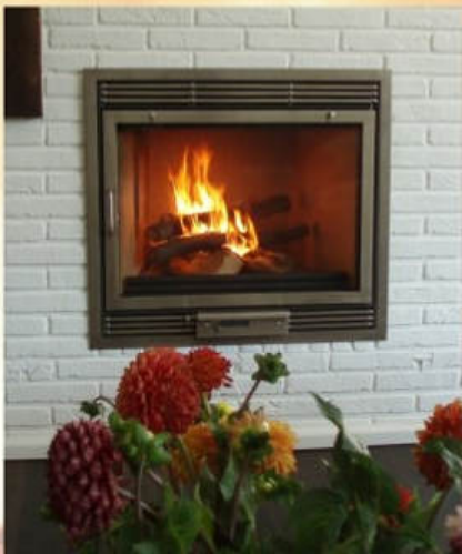
Edelstahl, Querlamellen, Blendrahmen