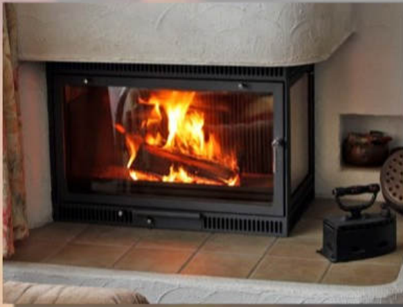
Anthrazit, Hochkantlamellen, Hohlkammer-Griff verchromt