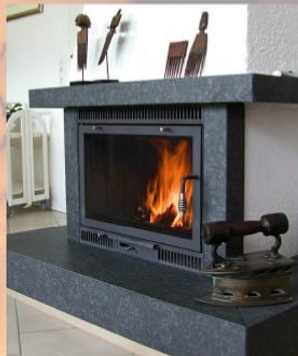
Anthrazit, Hochkantlamellen, Spiral-Griff